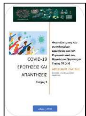
COVID-19 ΕΡΩΤΗΣΕΙΣ ΚΑΙ ΑΠΑΝΤΗΣΕΙΣ